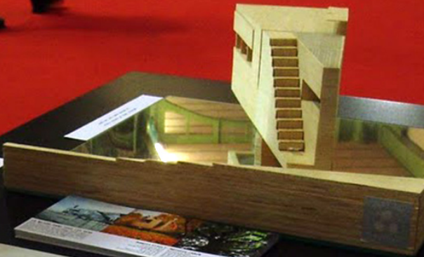
Architecture: [illegible] [illegible]

LA NATURE // NOTRE NATURE LA NATURE // NOTRE NATURE LA NATURE // NOTRE NATURE